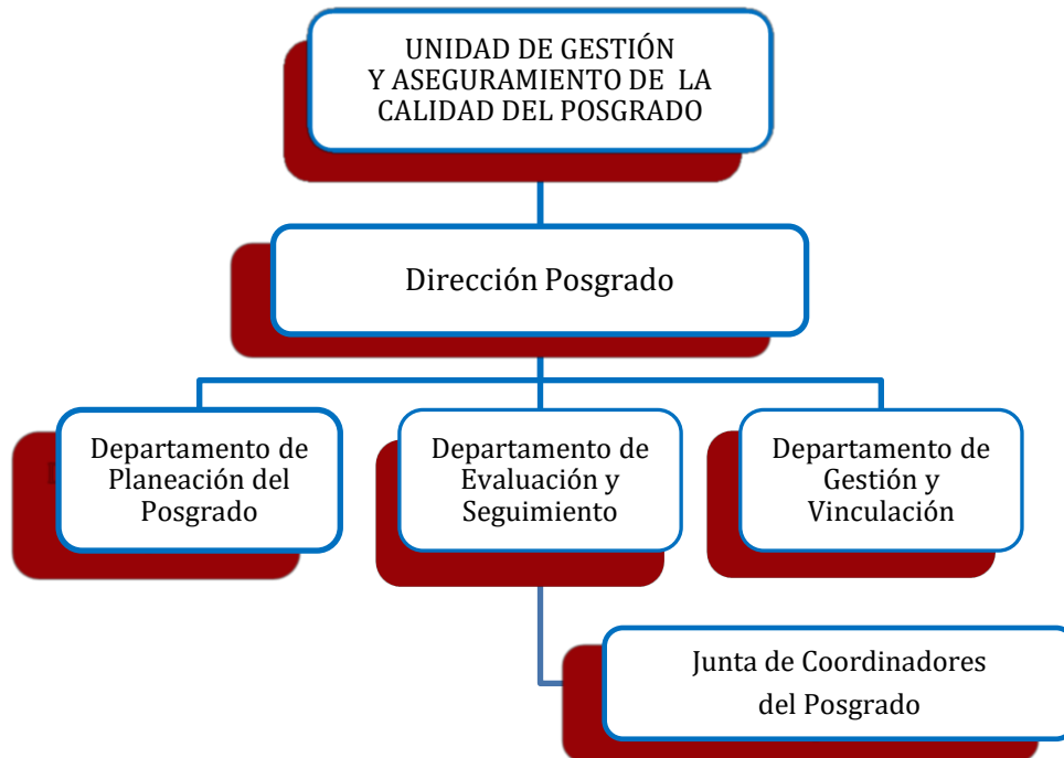
FIGURA 3. UNIDAD DE GESTIÓN Y ASEGURAMIENTO DE LA CALIDAD DEL POSGRADO.

tiempo de los logros obtenidos. Esta Unidad estará en comunicación directa con la Comisión Institucional a fin de tomar las decisiones que posibiliten la conservación y mejora de los índices de calidad de los posgrados de la universidad.