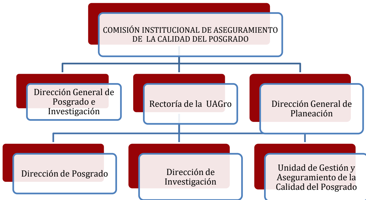
FIGURA 2. INSTANCIAS DEL SISTEMA DE ASEGURAMIENTO DE LA CALIDAD